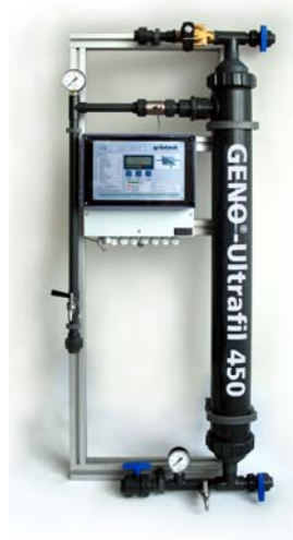
Abb. 1: GENO®-Ultrafil 450